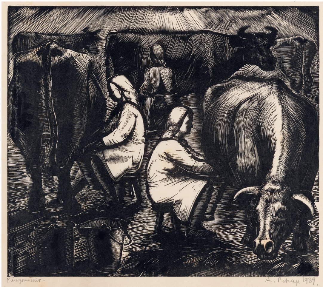
Erich Pehap. Lehmalüpsjad. 1939. Puugravüür. Lm 30×38,5