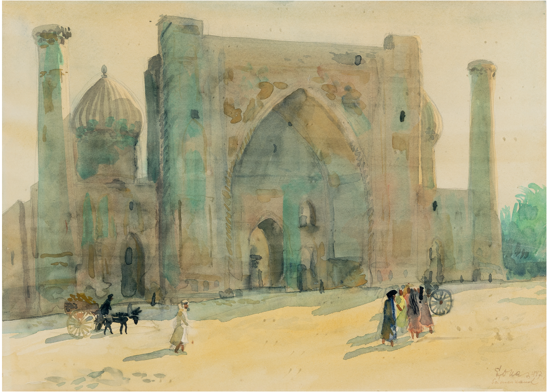
Evald Okas. Samarkand. 1947. Akwarell. 30 x 42,2