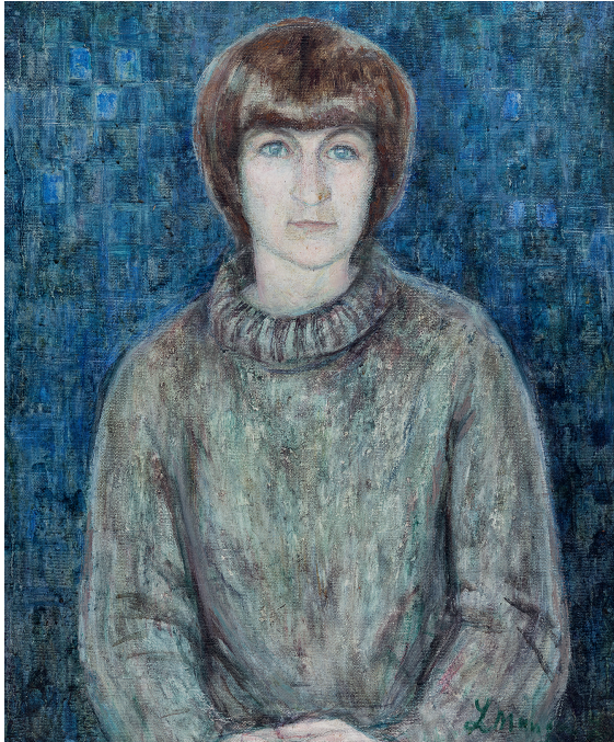
Leili Muuga. Anu portree. 1970ndate algus. Õli, lõuend. 67 x 54