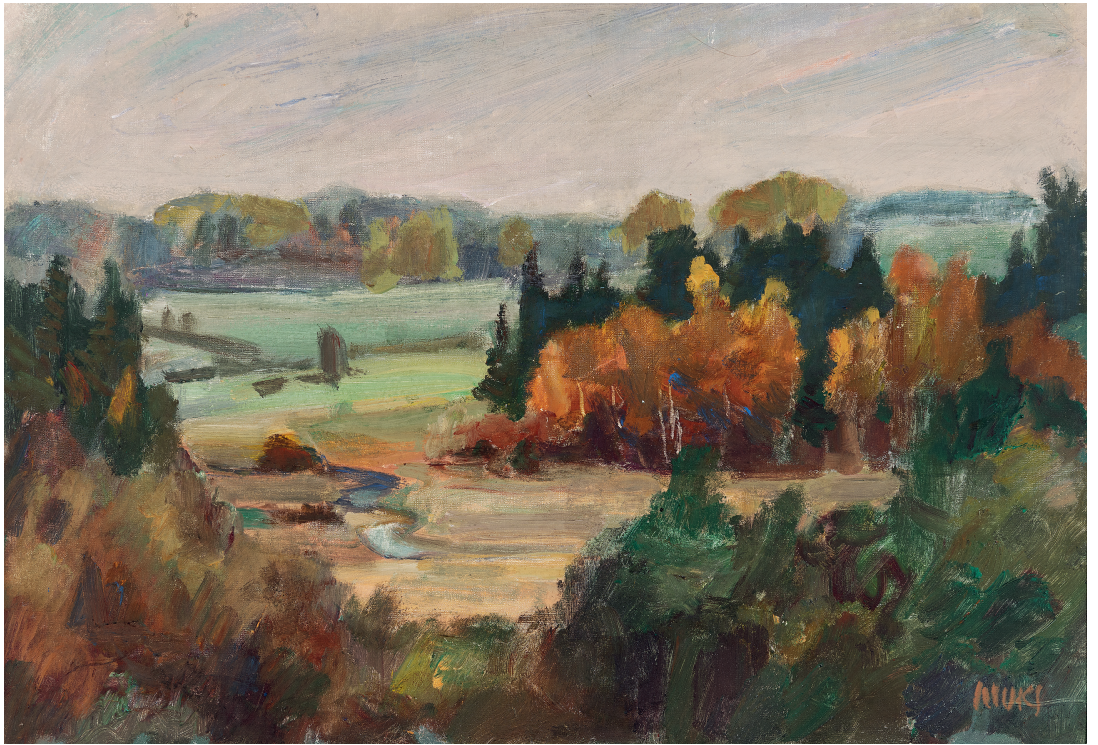
Juhan Muks. Raudna jõe org. 1950. aastad. Õli, papp. 34,5 x 50