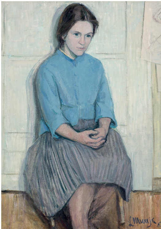
Leili Muuga. Anu portree. 1961. Õli, lõuend. 74,8×54,5. EKM