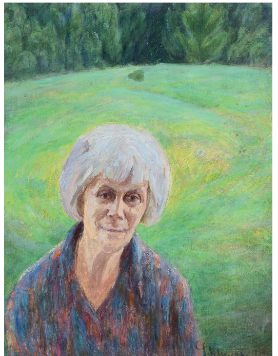
Leili Muuga. Valda Raua portree. 1975. Õli, lõuend. 67 x 50